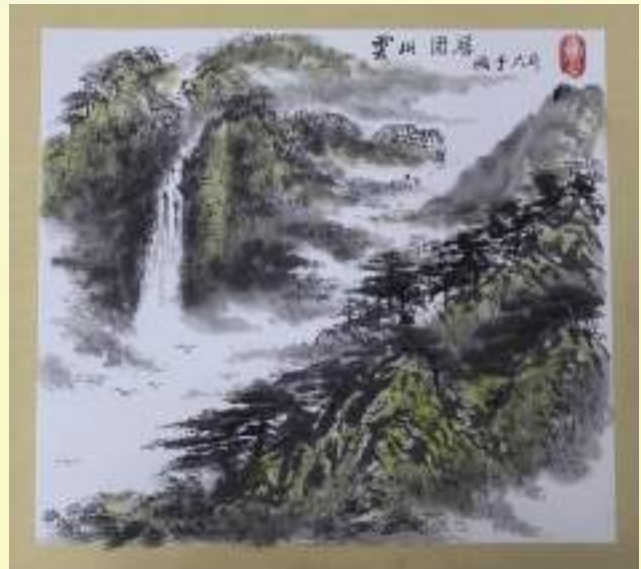
孔宪玉《云山固居》绘画类第三名